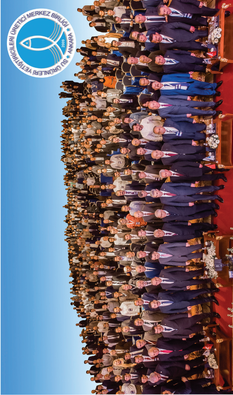
8. SU ÜRÜNLERİ YETİŞTİRİCİLİĞİ ÇALIŞTAYI 26-29 ŞUBAT 2020 ANTALYA